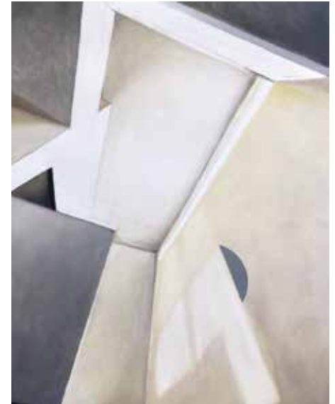
www.beatetischer.com Beate Tischer Shapes no. 03, 2018/19. Öl auf Leinwand, 80 x 60 cm