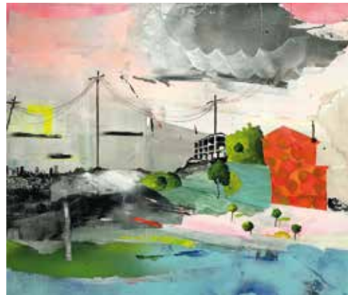
Birgit Borggrebe www.birgit-borggrebe.de Irrfahrt des Odysseus, 2017. Mischtechnik auf Leinwand, 100 x 120 cm