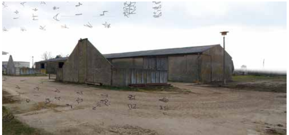
Juliane Duda Meinsdorf, 2017. Fujiflex auf Alu-Dibond, 100 x 213 cm